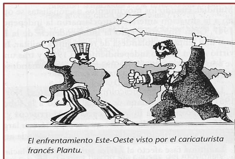
El enfrentamiento Este-Oeste visto por el caricaturista francés Plantu.

Esta etapa, que se extendió entre 1945 y 1990 se conoce como “Guerra Fría” por cuanto fue un enfrentamiento que tuvo lugar en lo político, ideológico, económico, social, tecnológico, militar, e informativo entre EE. UU y la ex URSS. Estas potencias actuaron como “ejes” de poder con influencia en el contexto internacional, cooperando económica y militarmente con sus países aliados, y deseando implantar dos sistemas económicos distintos: el Capitalismo y el Socialismo.