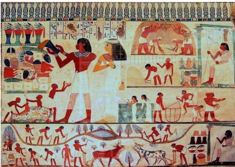
Escena de la tumba de Nakht